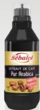
Extrait de Café Pur Arabica Sébalcé