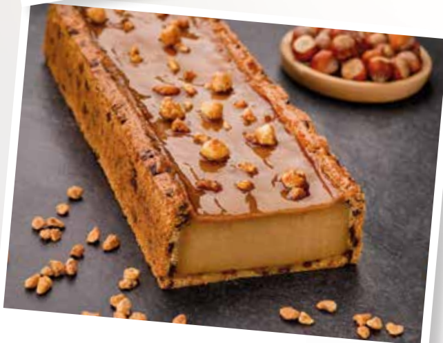
Flan Pâtissier Cookie Noisette