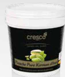
Pâte de Pistache Pure Kerman d'Iran cresco