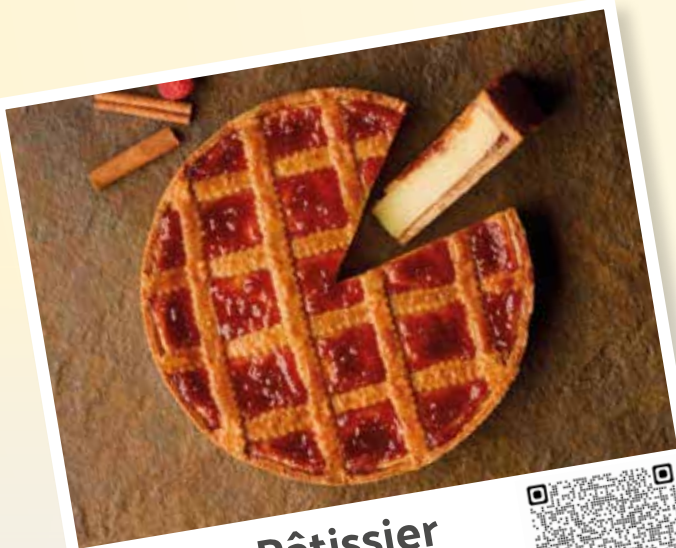
Flan Pâtissier Vanille Bourbon façon Linzer

Scannez les QR codes ci-dessous pour découvrir les recettes à base de Crème Pâtissière ancel