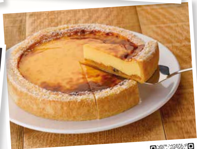
Flan Pâtissier Mangue-Passion