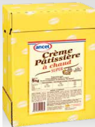
Crème Pâtissière à chaud Super ancel