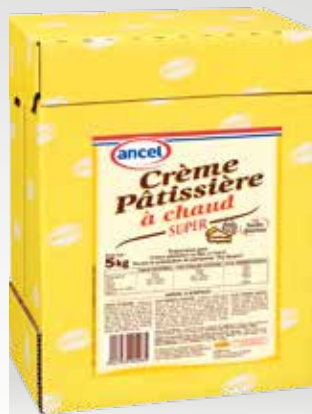
Crème Pâtissière à chaud Super ancel